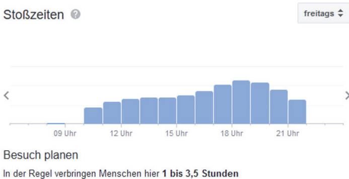
Abbildung 1: Stoßzeiten des Jugendstilbads in Darmstadt, Diagrammdarstellung von Google

Wann ist der beste Zeitpunkt in Darmstadt ins Schwimmbad zu gehen? Ein Blick in die Suchmaschine von Google verrät es: Anhand eines Diagramms kann erkannt werden, wie sich der Besuch aktuell gestaltet.